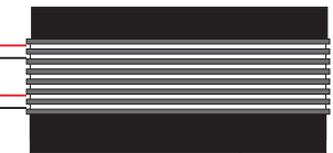
Amplificador para drivers e tweeters 2x150Wrms @ 4ohms