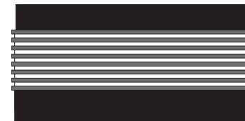
Amplificador para Alto-falantes 1x1100Wrms @ 2ohms